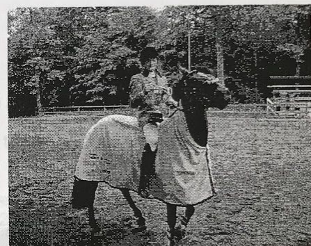
Lotta vann KM för ponny