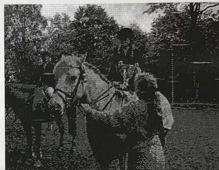
Katja och Mio klubbmästare 2001

Ett stort tack till Åke Edstrand Byggnads AB för sponsring!