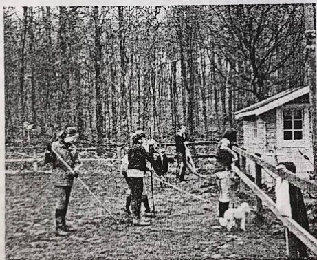
Det var stor uppslutning