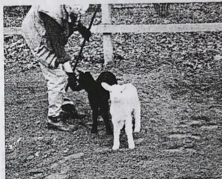
Bettan med Märtha och Greta som också var med.